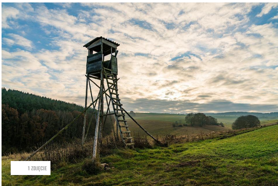
Myśliwska ambona (zdjęcie ilustracyjne)

Pod jedną z ambon położonych na terenie obwodu gliwickiego Koła Łowieckiego Ostoja ktoś ustawił lizawkę dla zwierząt. - To zwykłe kłusownictwo - oceniają myśliwi spoza koła, którzy zaalarmowali nas w tej sprawie.